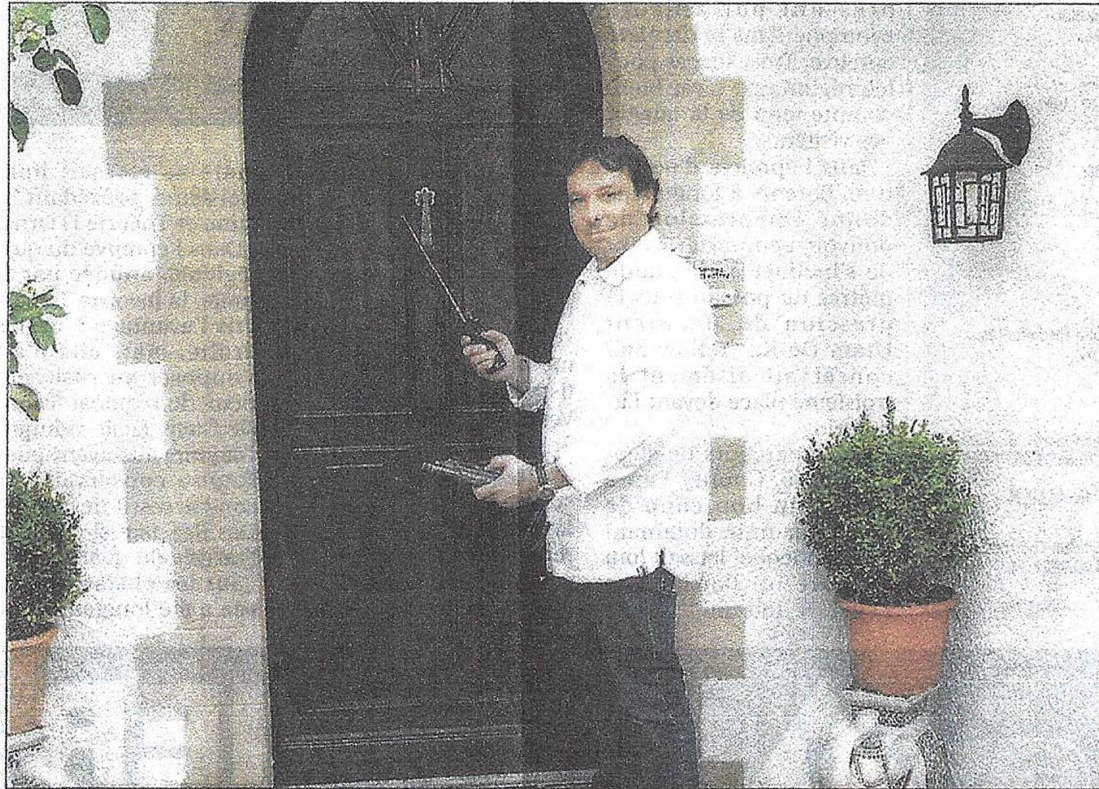
DÉTECTION. Avec des appareils perfectionnés, l'expert en géobiologie peut détecter les nuisances qui affectent le bien-être des êtres humains, mais également des animaux et des végétaux.

La géobiologie, c'est l'étude de l'ensemble des influences de l'environnement sur les êtres vivants, liée à la présence de perturbations géobiologiques comme les cours d'eau souterrains,